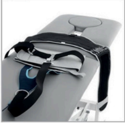
Système de ceinture universelle Deluxe pour traction lombaire (1410)