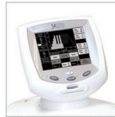
Système de traction TRU-TRAC® avec écran tactile monochromatique pivotant (4779)