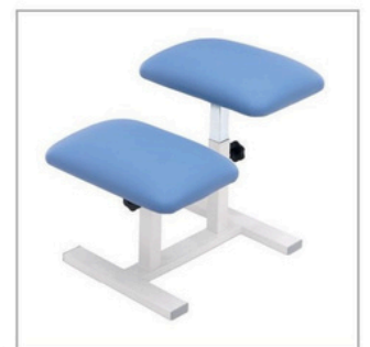
Tabouret de traction (3565)