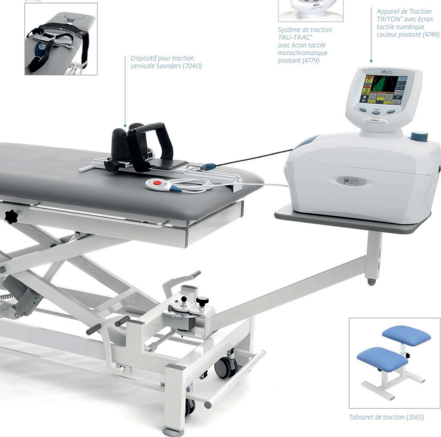
Appareil de Traction TRITON® avec écran tactile numérique couleur pivotant (4749)