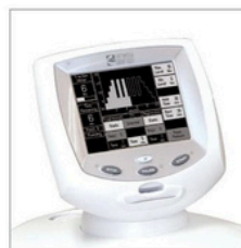
Système de traction TRU-TRAC® avec écran tactile monochromatique pivotant (4779)