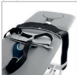
Système de ceinture universelle Deluxe pour traction lombaire (1410)