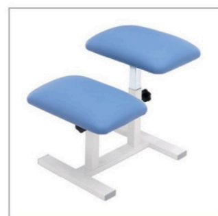
Tabouret de traction (3565)