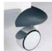
Roulette avec frein